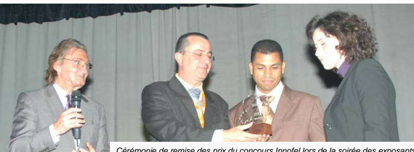
Cérémonie de remise des prix du concours Innotel lors de la soirée des exposants