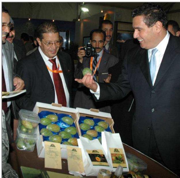
M. Aziz AKHANNOUCH (Ministre de l'Agriculture et de la Pêche Maritime) en tournée de stands.

Avec une surface d'exposition de 25 000 m 2 couverte sur 5 halls, Sifel Maroc est devenu le rendez-vous clé et interprofessionnel de la filière fruits et légumes qui se réaffirme en tant qu'événement de référence dans le calendrier des salons internationaux.