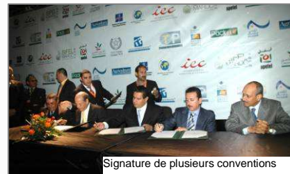
Signature de plusieurs conventions

accords de partenariat ont été signés entre le Ministère de l'Agriculture et de la Pêche Maritime, le Conseil de la Région de Souss-Massa-Drâa, les Préfétures de Taroudant, Tiznit et Chtouka Aït Baha et certains Conseils élus. Ces accords prévoient la construction et l'aménagement de routes rurales ainsi que l'ouverture de nouvelles pistes.